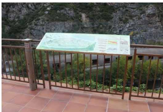
Panell informatiu del Geoparc al santuari de la Mare de Déu d'Arboló. M. Poyatos.

L'adequació i senyalització de l'accés al punt òptim d'observació es considera important, així com la neteja de l'accés i la superfície del LIG. El pont penjant i el camí al santuari de la Mare de Déu d'Arboló, requereixen un manteniment periòdic, sobretot les setmanes abans i després de l'aplec de la Mare de Déu (primer diumenge de Maig).