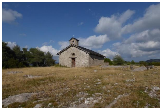
Capella-santuari de la Mare de Déu d'Esplà.

L'adequació de l'aparcament i accés al punt de referència es considera important, degut a la seva proximitat (i conseqüent risc) a la carretera N-260. També l'adequació i millor senyalització de l'accés al punt òptim d'observació al camí del Salt de la Núvia – Espluga de Cuberes.