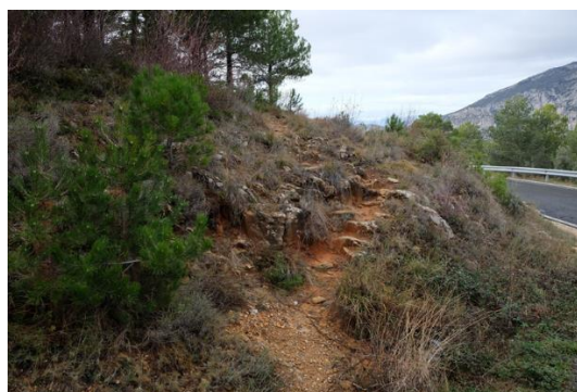
Estat del corriol d'accés al punt òptim d'observació. J. Panisello.

S'hauria de procurar mantenir net l'espai d'aparcament així com fer un manteniment del corriol d'accés al millor punt d'observació.