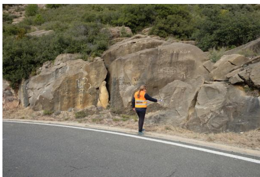
Roques afectades pel vandalisme (pintades). J. Panisello.

Es recomanen dues opcions per a poder fer-ne un ús divulgatiu d'aquest LIG. Primer, i el menys viable econòmicament, seria fer una passarel·la al costat de la carretera que ressegueixi a lo llarg el geòtop. Aquesta passarel·la estaria pràcticament suspesa a l'aire donat l'alt talús que ha excavat el barranc de Siall. L'altre opció seria fer un mirador de la zona, en un punt alçat al costat de la pista que porta a l'ermita de la Posa.