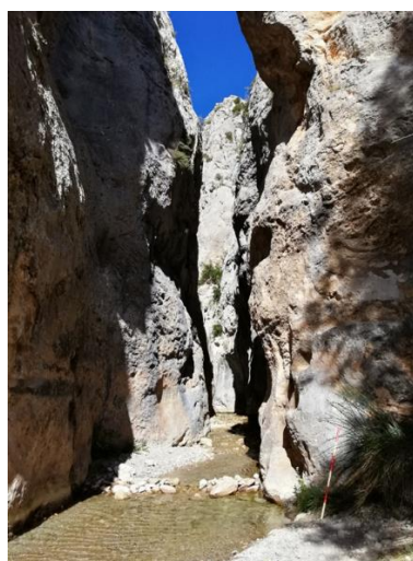
Congost del Foradot d'Abella. Congost excavat pel Riu Abella en les calcàries del Conicià-Santonjà que formen el front d'encavalcament. X. Mir.