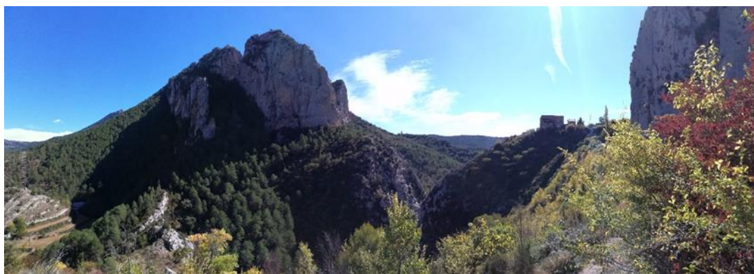
Vista panoràmica de la zona d'encavalcament a ambdós marges del Riu Abella des del camí de Mas Palou. X. Mir.