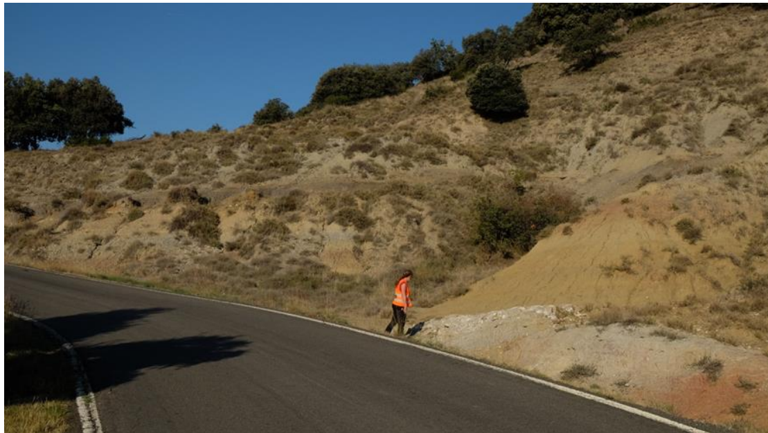
Vista general des de la carretera del geòtop de Claret. J. Panisello.