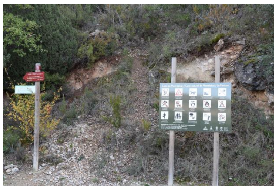
Cartell informatiu sobre les rutes (esquerra) i sobre les prohibicions i normes a seguir a la zona de la Pertusa-Montrebei. S. Boya.