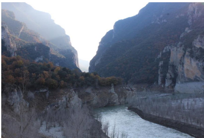
Vista de l'entrada del Congost de Montrebei des de les proximitats de la Masieta. S. Boya.