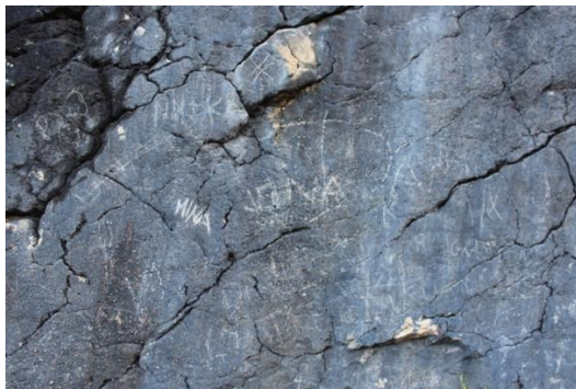
Noms gravats pels visitants en les parets de roca del Congost. S. Boya.

Convé trobar una solució d'ordenament per la massificació que està rebent aquest punt del Montsec. Per millorar la seguretat de les persones es recomana delimitar els espais afectats pels processos de vessants.