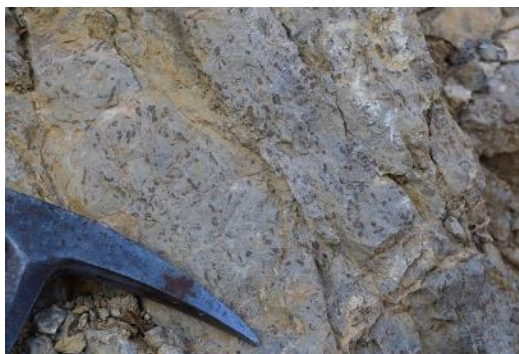
Detall de les calcàries oolítiques de Lias (Juràssic). S. Boya.

No es considera necessari prendre mesures restrictives en quan al accés i visita d'aquest LIG, però seria convenient avisar de la prohibició de recol·lecció de fòssils, ja que aquests nivells són molt rics en fauna marina, principalment.