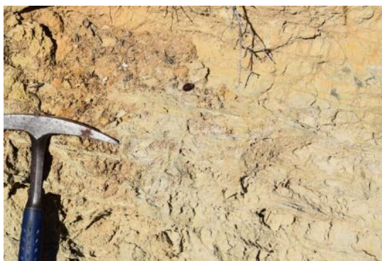
Guixos triàsics amb carnoles. S. Boya.