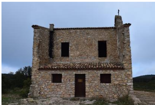
Ermita de Sant de Jordi, en el punt òptim d'observació d'aquest LIG. S. Boya.

Seria aconsellable una restauració dels panells existents tant a la ermita com al bufadors de Sant Jordi, ja que contenen informació sobre el patrimoni cultural i natural interessant però que presenten un estat de degradació elevat.