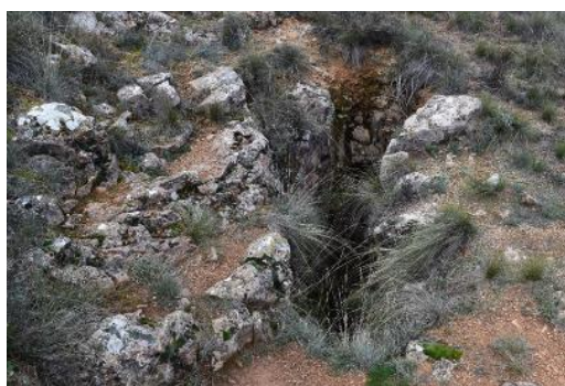
Bufador de Sant Jordi les proximitats de l'Ermita de Sant de Jordi, en el punt òptim d'observació d'aquest LIG. S. Boya.