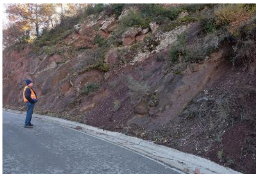
Pista asfaltada per on discorre el LIG, on hi ha caiguda pedres. J. Panisello.

No es creu que s'hagi de dur a terme cap acció de protecció del LIG, donat el seu estat actual.