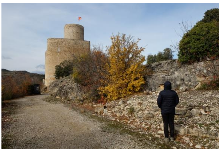
Vista general de l'aflorament de la calcària amb alveolines al costat del castell de Mur. J. Panisello.

S'hi pot accedir en cotxe per la carretera LV-9124 des del poble de Guàrdia de Noguera que està a 9,1 km de l'EIG del Castell de Mur, o per la carretera C-1311 des de Fígols de Tremp que està a 12,1 km de distància. Hi ha diferents camins que es poden fer a peu que arriben fins el Castell de Mur, com és el cas del camí de Guàrdia de Noguera a Castell de Mur o el de Vilamolat a Castell de Mur. Hi ha un aparcament als peus del castell on hi caben més d'una desena de cotxes i un autocar.