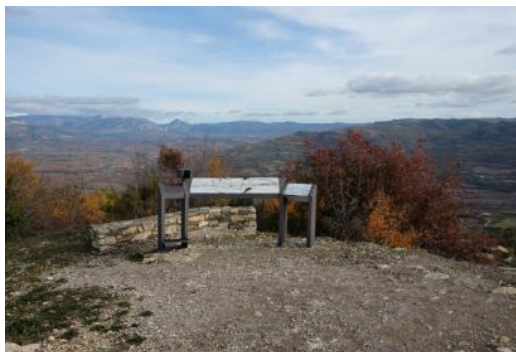
Localització del mirador amb un panell de contingut geològic. Es pot apreciar la manca d'una tanca de seguretat. J. Panisello.

Convé substituir els panells deteriorats.