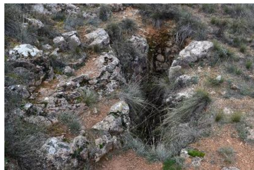
Bufador de Sant Jordi les proximitats de l'Ermita de Sant de Jordi, en el punt òptim d'observació d'aquest LIG. S. Boya.